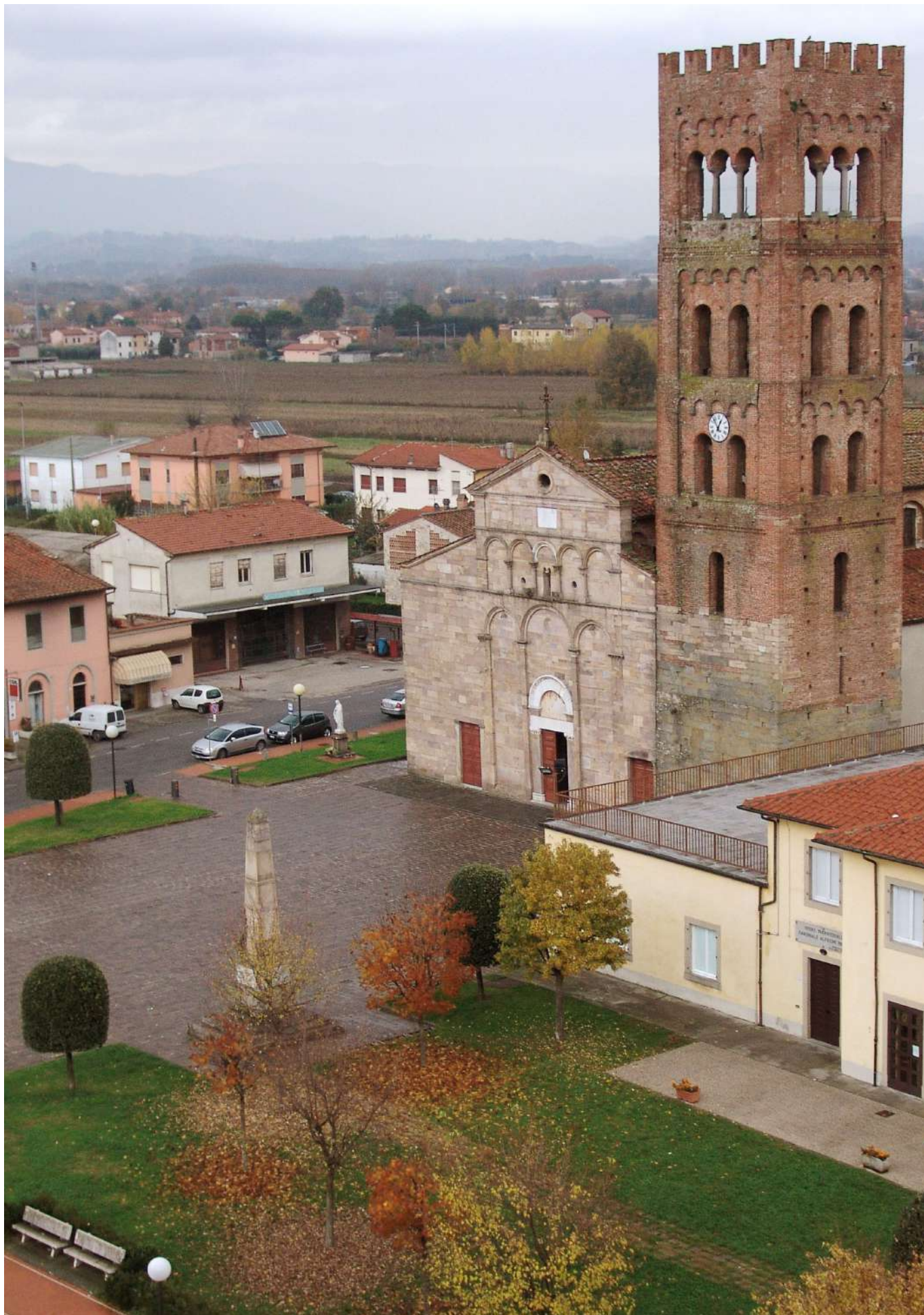
Chiesa di Capannori