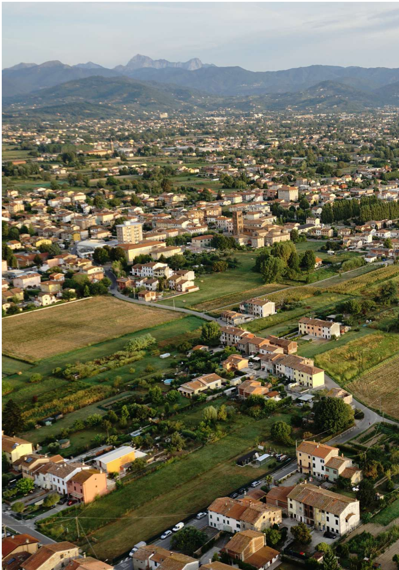
Vista di Capannori dall'alto