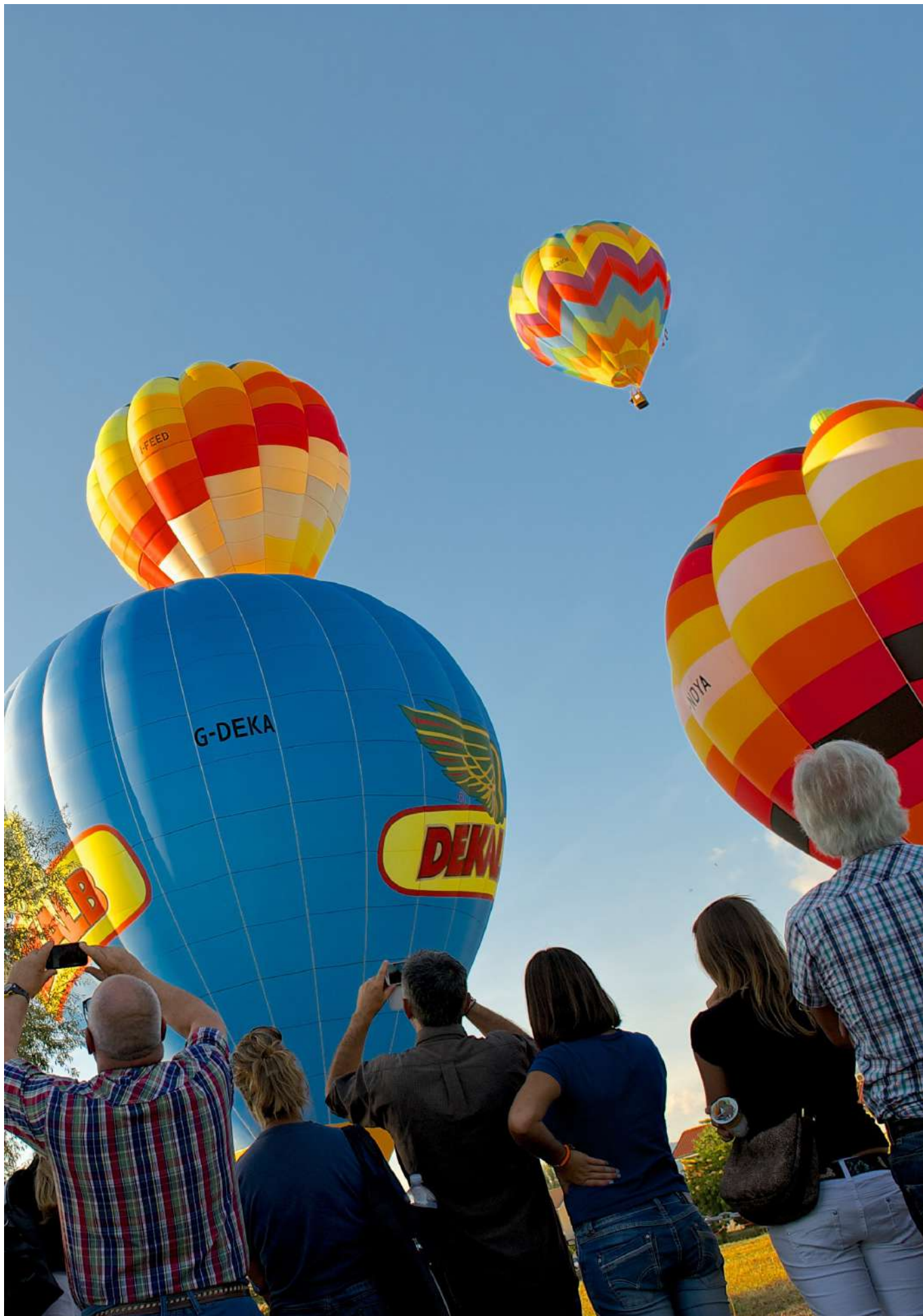
Festa dell'Aria e dello Sport - Capannori