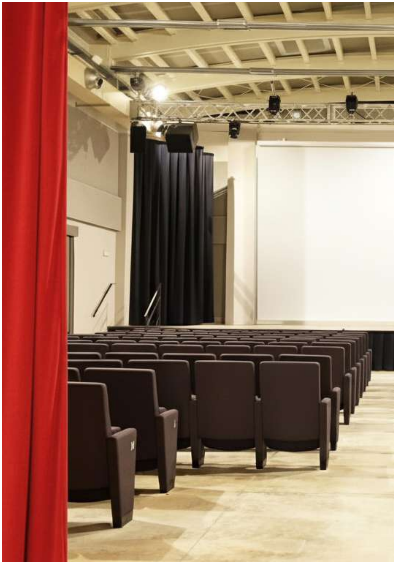
Cinema Teatro Artè - Capannori