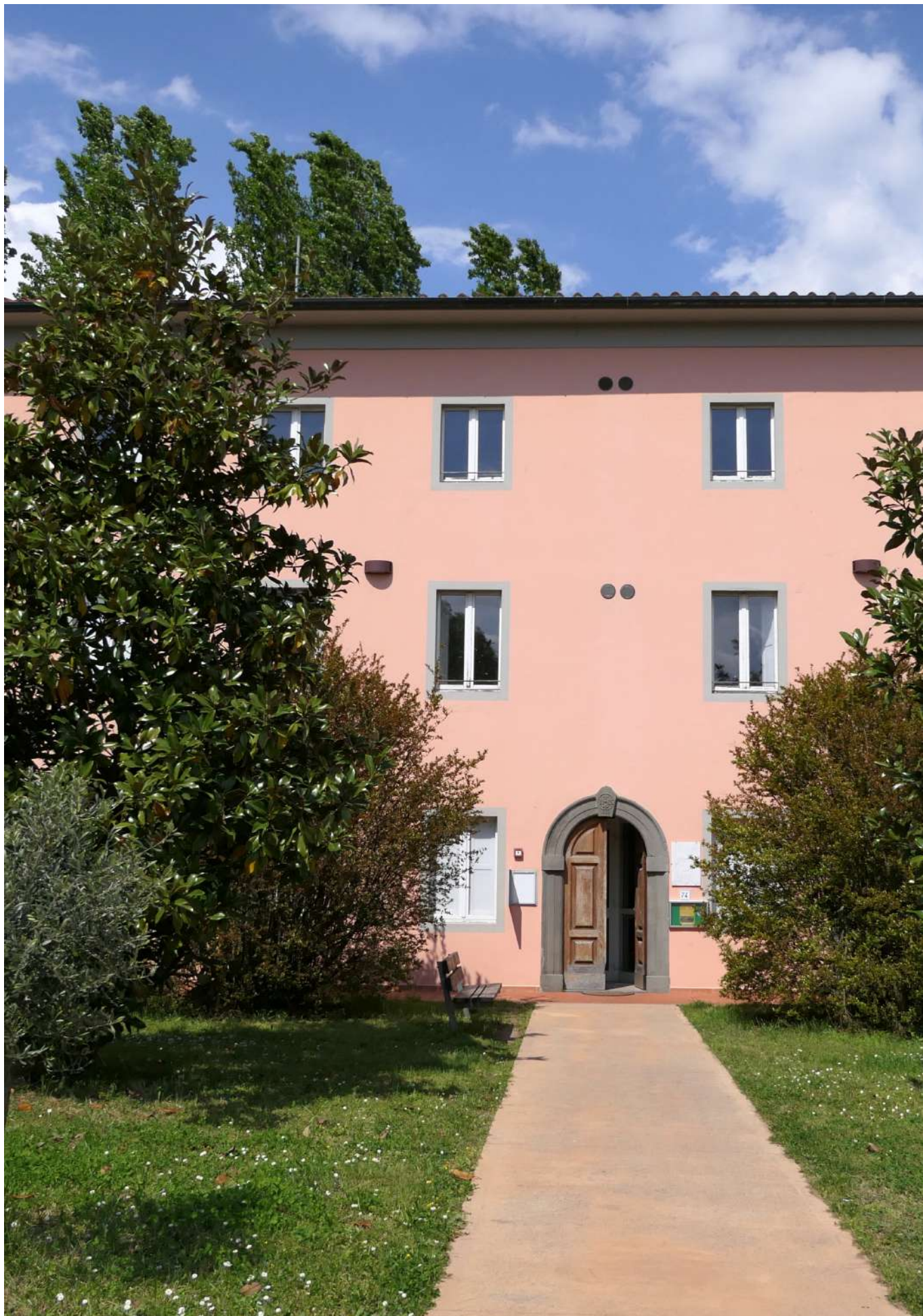
Museo Athena - Capannori