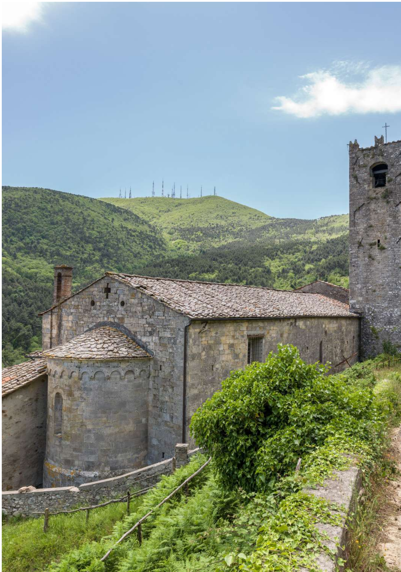
Chiesa di Ruota