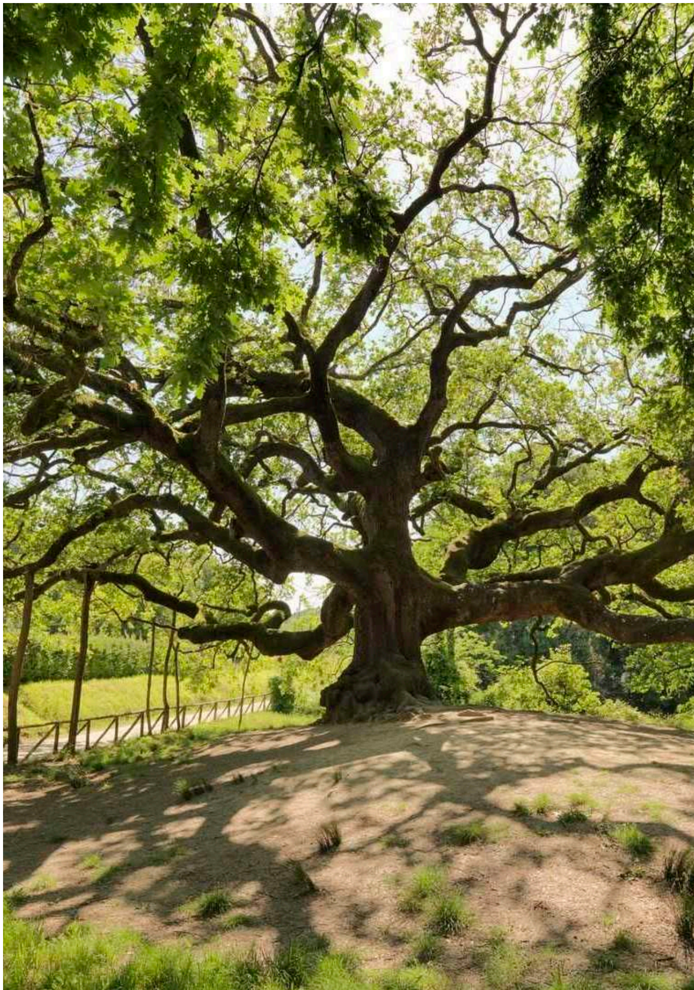
La Quercia delle Streghe