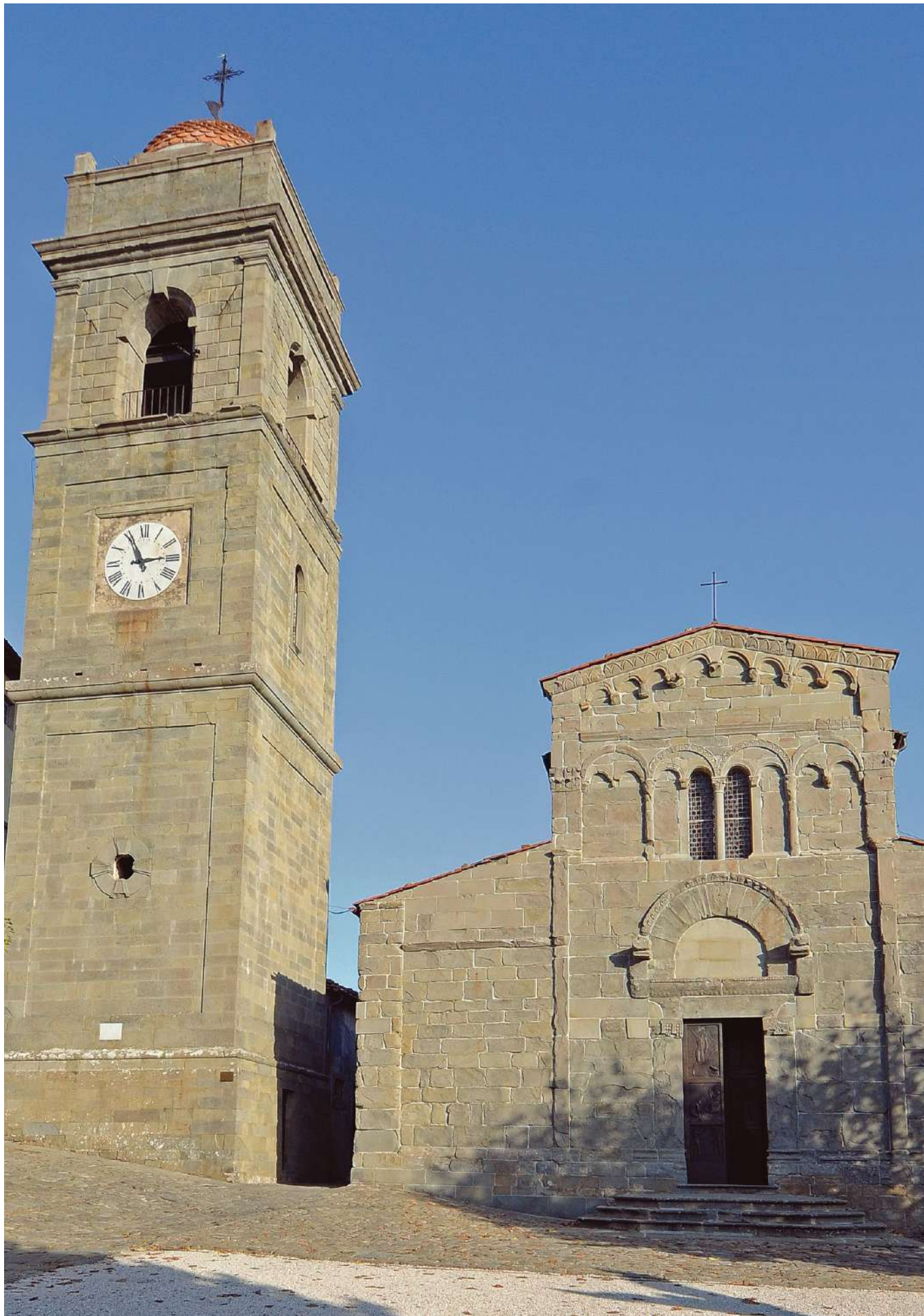
Pieve di San Gennaro