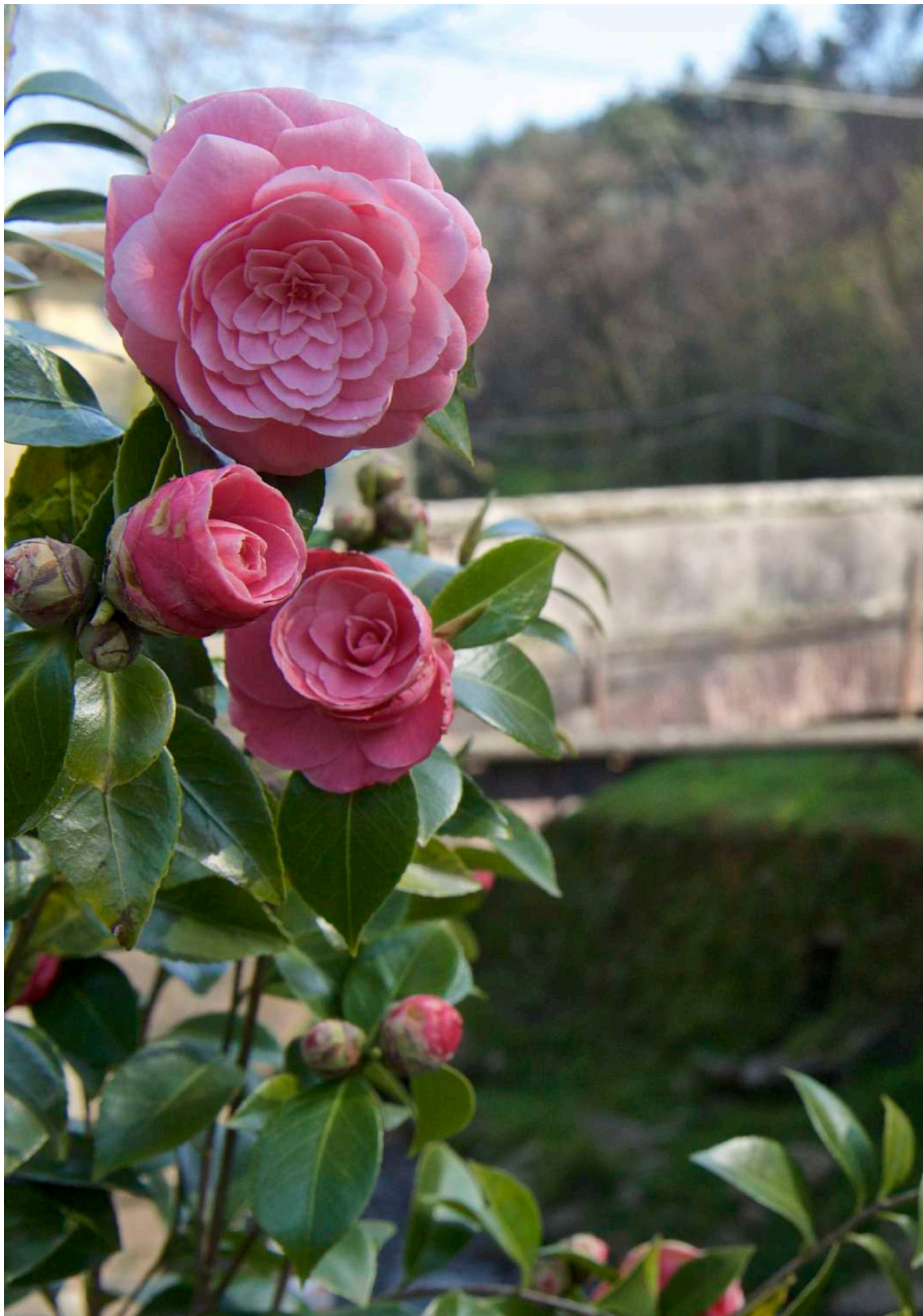
Mostra delle Camelie - Sant'Andrea di Compito