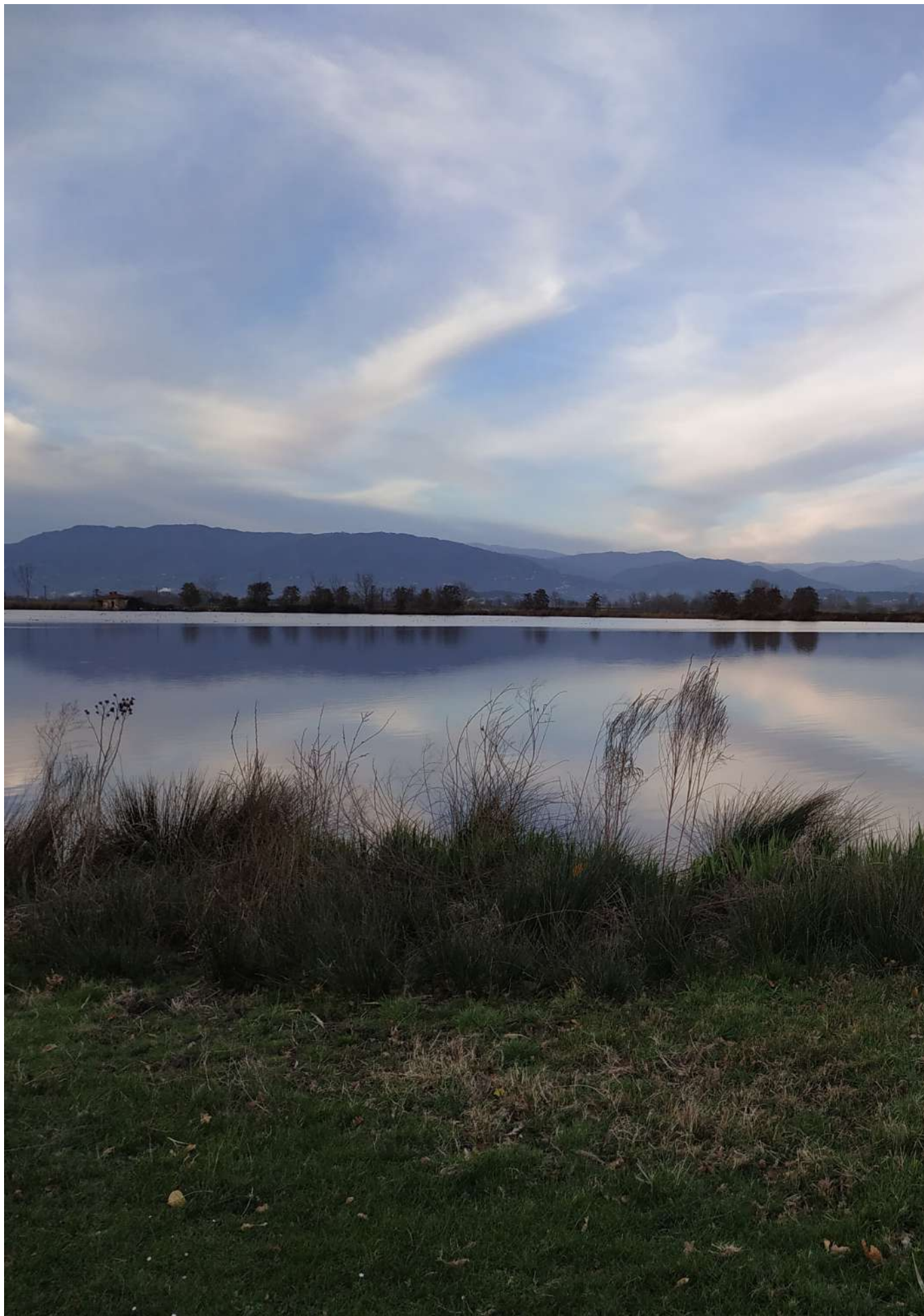
Lago della Gherdesca